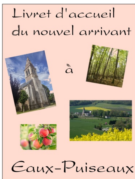
Projet fictif de page de garde

La commission «Accueil-Animation-Culture» travaille actuellement à la réalisation d'un livret d'accueil destiné aux nouveaux arrivants dans notre village. Ce livret sera bien entendu remis gracieusement aux actuels Puisotins qui en feront la demande.