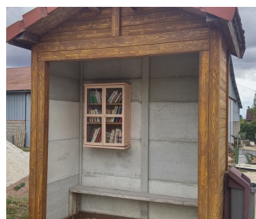
Le kiosque de la rue de l'Église

Les membres de cette commission s'activent à restaurer l'abribus de l'ancienne poste (remplacement de planches, réfection de la couverture, mise en place des étagères et application d'une lasure ou d'une peinture). Il sera parachevé très prochainement et devrait contenir rapidement de nombreux livres.