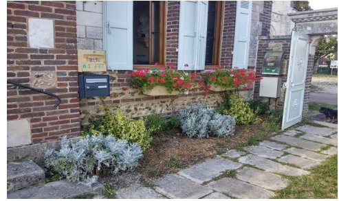
Les bacs à fleurs de la Mairie

D'autres interventions ont été effectuées par les membres de la commission, comme le nettoyage des abords du cimetière et le nettoyage en cours des panneaux de la place de l'Église, de la place de la Libération et du chemin de Puisieux.