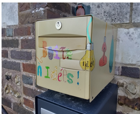
La boîte à idées en façade de la Mairie

La boîte à idées a trouvé sa place en façade de la mairie. Elle a déjà permis de recueillir les premières idées et remarques des Puisotins. C'est une manière très simple de solliciter les commissions municipales, qui auront le souci de répondre à vos attentes avec tout le sérieux qui s'impose.