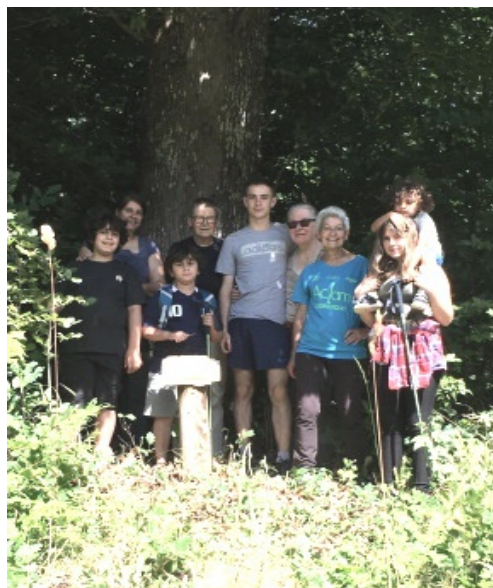
La belle équipe ...