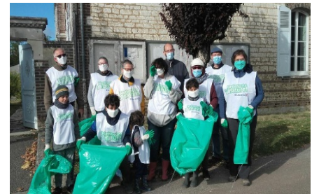
Au départ de l'opération ...

À l'heure fixée, les plus courageux et les plus motivés du village, chaudement vêtus, ... au point que l'un (ou l'une) d'entre eux est difficilement reconnaissable ..., ont fait oeuvre utile. Vers midi, les sacs étaient pleins, bien des Puisotins peuvent en témoigner.