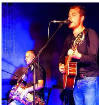
NAJAR & JOLIVET

Pensez à réserver vos places pour le concert du 16 octobre