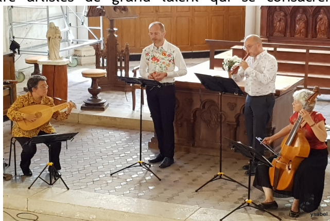
L'ensemble Enthéos interprétant Pierre de Ronsard

Le public s'est rendu nombreux à cette manifestation de qualité qui marquait la reprise des activités musicales organisées par le Festival d'Aix-en-Othe.